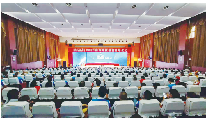
▲启动仪式会场现场

质量始于投料,开局决定全局。今年,是新中国七十华诞,恰逢白云边创“国优”四十周年。白云边首次隆重举办酿造投料启动仪式,旨在企业转型升级时期大力弘扬奋斗精神,坚守创优初心,坚持以质取胜,推进守正创新,向高质量发展坚定前行。