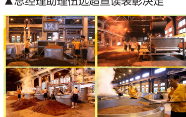
▲酿造车间投料生产现场