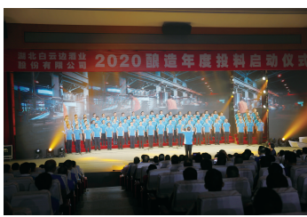
▲大合唱《咱们工人有力量》